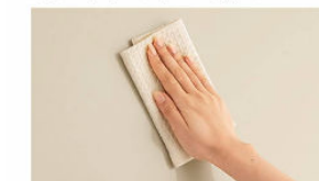
※長くお使いいただくために、やわらかい布でお手入れしてください。