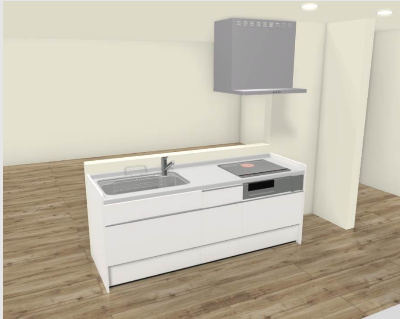
実物を撮影した画像ではないため、実物と異なる場合があります。見積記載品以外はイメージです。*床名：ラフオークF (DB) 横・ラシッサD