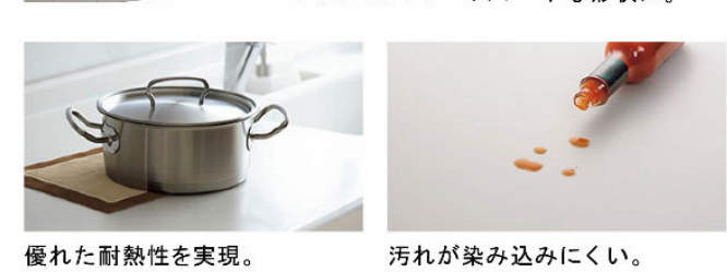
優れた耐熱性を実現。 人造大理石トップ