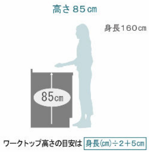
ワークトップ高さの目安は \frac{\text{身長(cm)}}{2} + 5\text{cm}