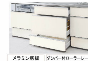
スライドストッカー 3段引出し