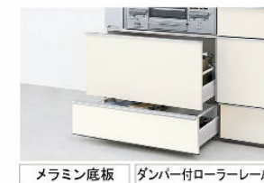
スライドストッカー (ポケットなし)